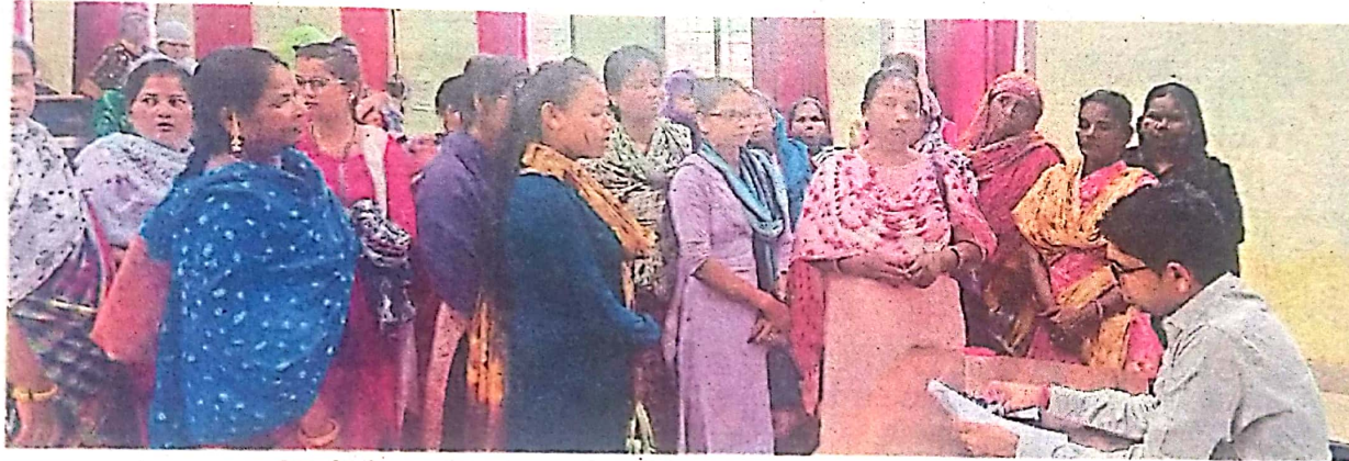
जगदलपुर। स्वच्छता दीदियों से उनकी समस्याएं पूछते निगम आयुक्त हरेश मंडावी।

आयुक्त के द्वारा निगम में कार्यरत नियमित कर्मचारी, प्लेसमेंट कर्मचारियों एवं स्वच्छ भारत मिशन के तहत कार्यरत स्वच्छता दीदियों के समस्याओं के निराकरण के संबंध में आयुक्त ने नई पहल की शुरुआत की। ज्ञात हो कि निकाय में कार्यरत